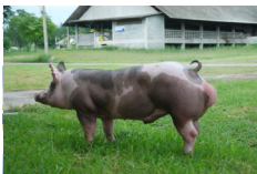
เป็ยตฺรยง

สุกรสายพ่อพันธุ์ของกรมปศุสัตว์ มีพันธุกรรมนิ่งถ่ายทอดดี ให้เนื้อแดงมาก รูปร่างสวย ขาแข็งแรง เหมาะใช้เป็นพ่อพันธุ์