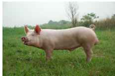
ลาร์จไวท์

สุกรสายแม่พันธุ์ของกรมปศุสัตว์ พันธุ์กรรมนิ่งสม่ำเสมอ ให้ลูกตก เลี้ยงลูกเก่ง ใช้งานได้นาน ขาแข็งแรง