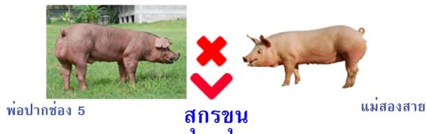
พ่อปากช่อง 5

เกษตรกรที่ต้องการผลิตสุกรขุน นำสุกรพ่อพันธุ์ที่เป็นสายพ่อพันธุ์ (พ่อสุดท้าย) เช่น สุกรพันธุ์ดูริค สุกรพันธุ์ปากช่อง 3 สุกรพันธุ์ปากช่อง 5 มาผสมกับแม่พันธุ์สองสาย ลูกที่ได้นำมาใช้เป็นสุกรขุน จะได้สุกรขุนที่แข็งแรง โตเร็ว