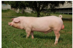
แลนด์เรซ